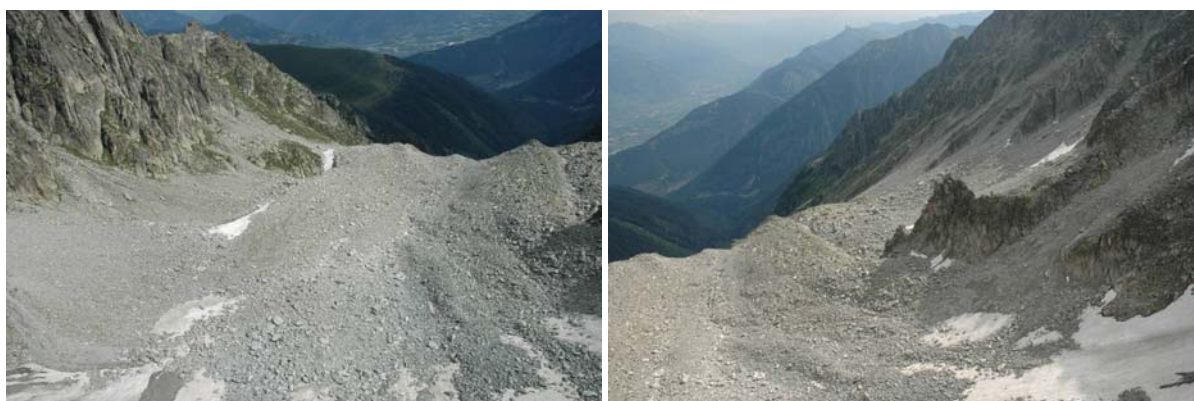
Cuvette d'accumulation des débris de roche (à arrière-plan : la vallée du Rhône)

Il est intéressant de relever qu'alors que les précipitations n'ont débuté qu'en fin de journée, à midi déjà un touriste a été gêné par des coulées de matériau à l'endroit où le sentier pédestre franchit les Jures. Cela tend à démontrer que sous l'effet de la chaleur cumulée, la tranche supérieure du glacier rocheux se trouvait fin juillet dans une phase d'équilibre instable par le seul fait de sa fonte et de celle des névés.