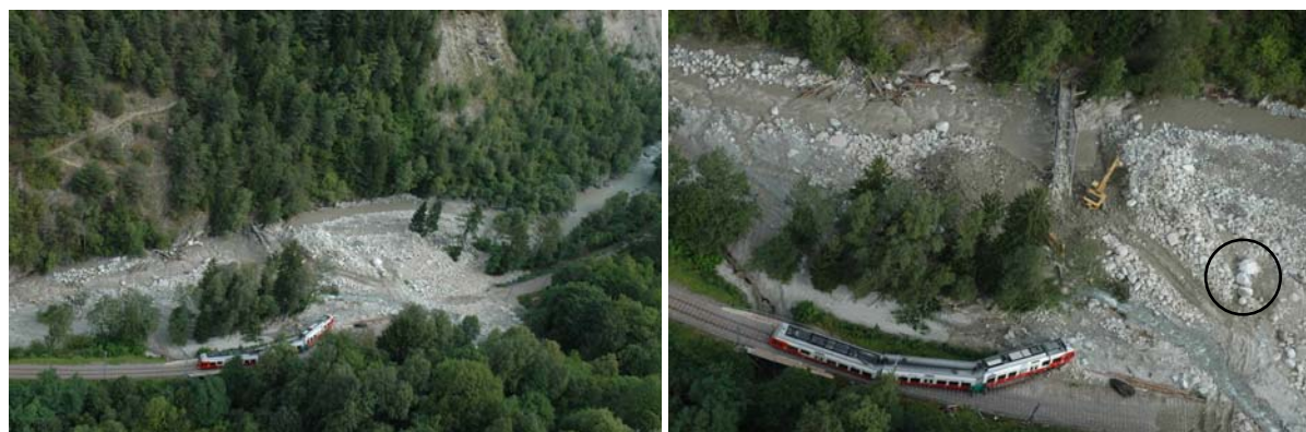
Situation à l'embouchure du Durnand dans la Dranse au lendemain de la crue du Durnand (noter la taille des blocs transportés)

Comme cela est souvent le cas dans la géomorphologie alpine, le rétrécissement aval des vallées latérales laisse peu de place aux voies de communication. Au Borgeaud, nom local de la confluence des deux cours d'eau (photos ci-dessous), la ligne de la société de chemin de fer locale (TMR) « slalome » dans le lit majeur de la Dranse alors que la route internationale du Gd-St-Bernard la surplombe à flan de coteau par une succession de viaducs et galeries.