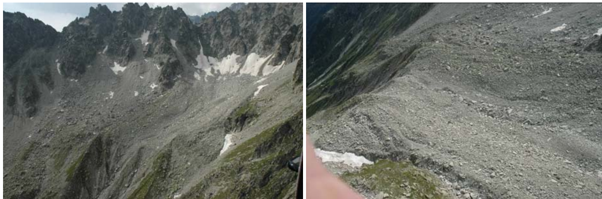
Glaciers rocheux et cuvette d'accumulation (à droite : cassure de pente, rigoles d'érosion)

On relève sur la droite la structure en forme de cuvette qui a concentré la plus grande quantité de débris du glacier rocheux et notamment la partie fine du matériau, indispensable pour assurer le transport des gros blocs et abraser le lit du torrent.