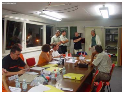
La cellule de crise

Pendant ce temps, nous avons commandé certaines machines de chantier. Avec l'expérience de l'événement pluvieux d'octobre 2000, nous savions que la Dranse pouvait charrier énormément de troncs d'arbre. Or sur ce cours d'eau, le tablier d'un certain nombre de ponts est relativement bas. Nous avons déjà pris la décision 6 ans auparavant d'amener des machines de chantier, de façon à pousser les troncs vers le bas à leur arrivée pour qu'ils puissent passer sous le tablier.