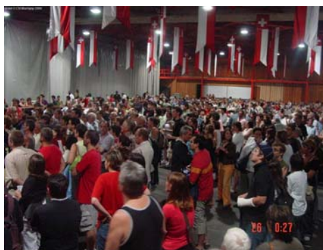
Personnes évacuées - Centre d'exposition, Martigny

Nous avons également reçu de l'aide de la part des corps de pompier et de protection civile des communes voisines ».