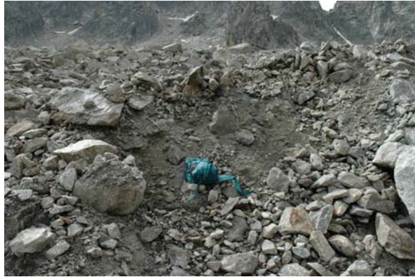
Détail de la tranche superficielle du glacier rocheux avec rigole d'érosion creusée par l'événement

Dans l'une des rigoles creusées par l'événement du 25 juillet, « deux jours plus tard on entendait très bien l'eau de fonte couler en profondeur ».