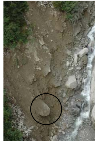
Secteurs successifs de dépôt et d'érosion du lit du torrent

Plus haut on observe les embranchements supérieurs du torrent. On y trouve un dépôt intermédiaire de matériau qui semble avoir été peu remobilisé par l'événement.