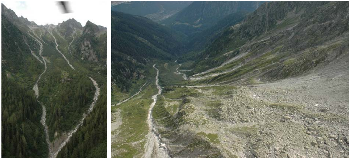
Confluence des Jures (embranchements supérieurs du torrent) avec à droite le dépôt intermédiaire

Plus haut on observe les embranchements supérieurs du torrent. On y trouve un dépôt intermédiaire de matériau qui semble avoir été peu remobilisé par l'événement.