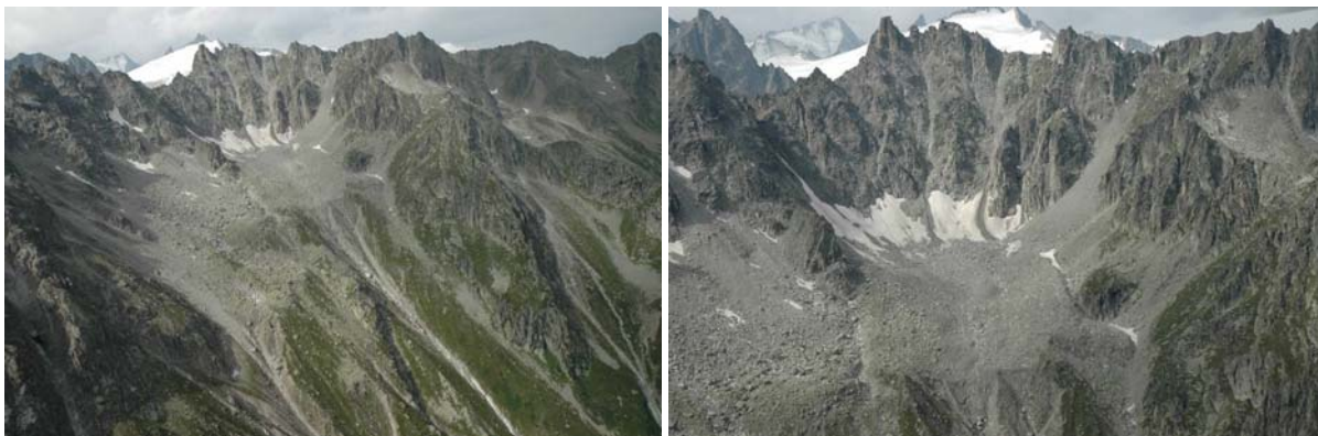
Langues de glacier rocheux à l'origine de la lave torrentielle du torrent Durnand

Entre 2400 et 2500 m, directement au pied des crêtes de gneiss, on observe les « langues » de glacier rocheux qui ont produit la lave torrentielle du 25 juillet.