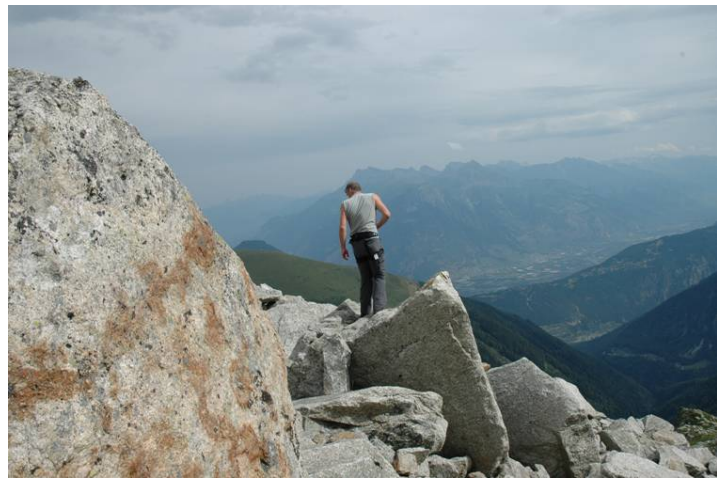
Echelle de la taille des blocs du glacier rocheux (photo de droite : à l'arrière-plan la ville de Martigny)

A relever la forme anguleuse typique des blocs qui démontre leur origine autochtone, à savoir qu'ils proviennent directement des falaises sus-jacentes.