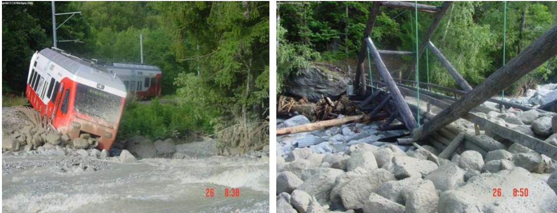
Voies de chemin de fer déplacées sur plusieurs dizaines de mètres et passerelle engravée au lendemain de la crue