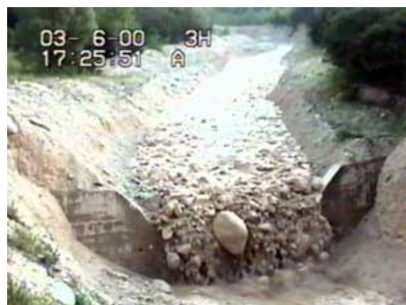
Passage du front de la lave torrentielle du 3 juin 2000 (~ 5 km/h et 10 000 m 3 )