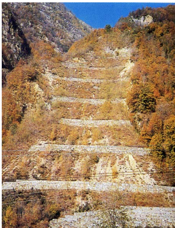
Photo 5.2a.2 – Eboulement de Theilly aménagé à l'aide de terrasses formées avec des écrans de gabions.

En 1961, un glissement de terrain a affecté le versant droit de la vallée du torrent Lys, à proximité du lieu-dit Theilly, dans la commune de Lillianes. L'aménagement et le confortement du versant ont été réalisés à l'aide de terrasses formées avec des écrans de gabions (Photo 5.2a.2) et de drainages, eux-mêmes faits à l'aide de gabions.