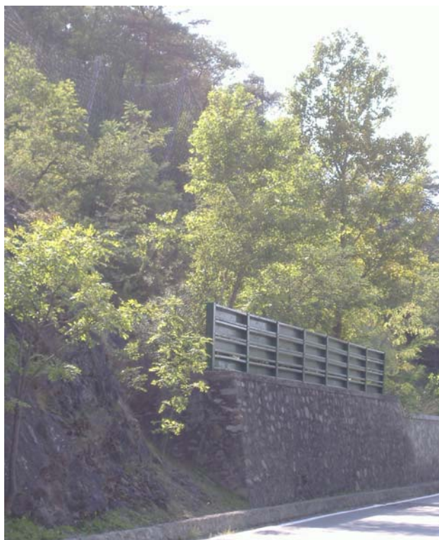
Photo 5.2a.1 – Ecran rigide en traverses métalliques. A noter l'écran déformable de filets à anneaux ROCCO® situé à l'arrière.