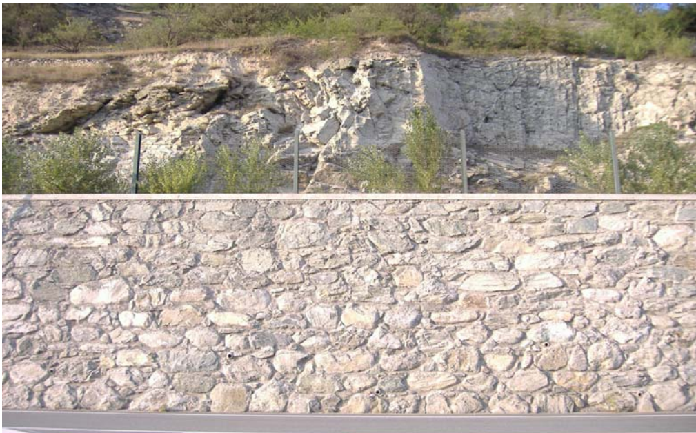
Photo 5.2b.1: Vue d'ensemble du mur de soutènement et de la barrière fixe de grillage.

Pour éviter les dégâts dus aux chutes de blocs depuis le massif rocheux très fracturé surplombant la route, l'ANAS a réalisé un mur de soutènement de 5.5 m de hauteur, surmonté par une barrière fixe de 100 m de longueur constituée par un grillage à double torsion à maille hexagonale (60 x 80 mm), renforcée chaque 30 cm par des câbles horizontaux en acier (d'un diamètre de 12 mm). Les poteaux ont une hauteur d'environ 2 m et sont distants de 4 m. Une fosse de réception a été mise en place à l'arrière du mur.