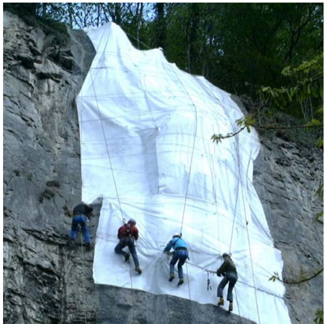
Photo 5.4.2: Treillis métallique et géotextile de recouvrement pour limiter les projections dues au minage de 60 m 3 de roche dans la zone à bâtir de Saint Maurice.