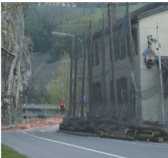
Photo 5.4. 3: Filets PVC contre les projections dues au minage (commune de Saint Maurice)